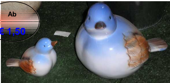
Keramikvogel „Gerda“ verschiedene Größen