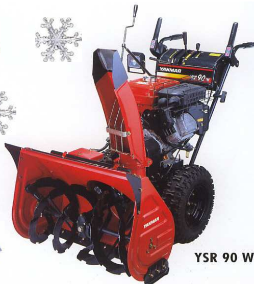
YSR 90 W